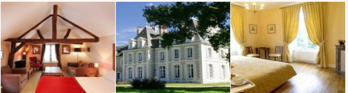
Voorbeeld van het type accommodatie

U verblijft in kleine kastelen, ****-hotels of karaktervolle chambres d'hôte (bed and breakfasts) waar u kunt het "vie de château" in een spectaculaire omgeving leven. Zij worden voor een onberispelijke service geselecteerd. Het ontbijt is inbegrepen.