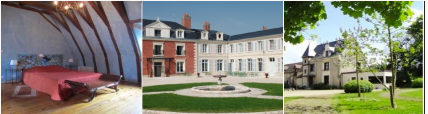
Voorbeeld van het type accommodatie

U logeert in ***type hotels of chambre d'hôte (bed and breakfast) die voor de kwaliteit en het warme onthaal werd geselecteerd. Het ontbijt is inbegrepen.