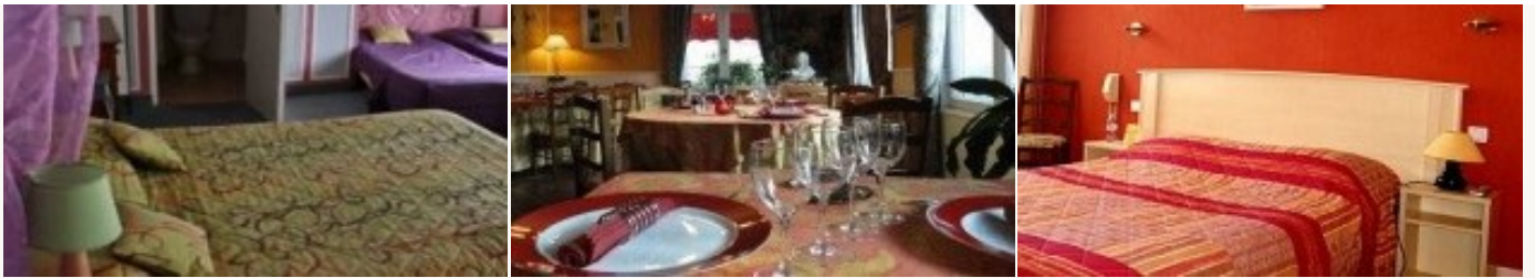
Voorbeeld van het type accommodatie