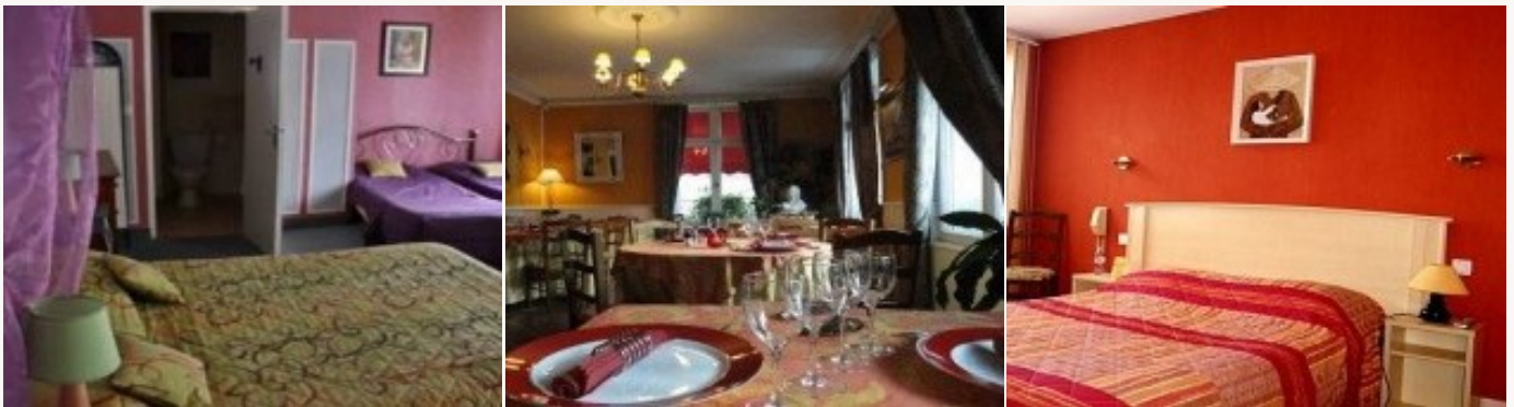
Voorbeeld van het type accommodatie

U overnacht in **type hotels die alle comfort bieden na een dag in de buitenlucht. Deze familie hotels zijn gezinsvriendelijke. Het ontbijt is inbegrepen.