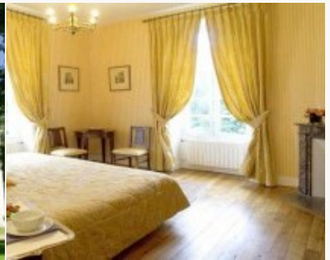
Voorbeeld van het type accommodatie