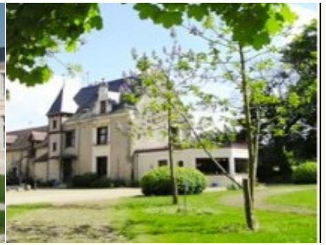
Voorbeeld van het type accommodatie