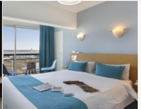
* Unterkunftbeispiel der Kategorie entsprechend