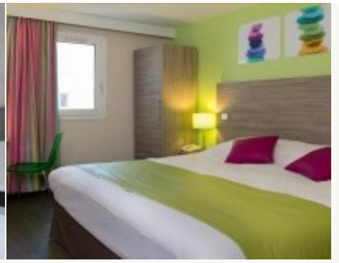
* Unterkunftbeispiel der Kategorie entsprechend